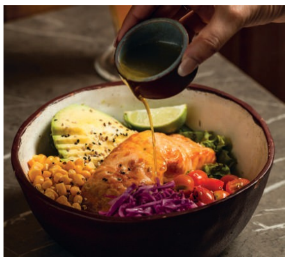
INGREDIENTES FRESCOS Y NATURALES en cada uno de nuestros platos